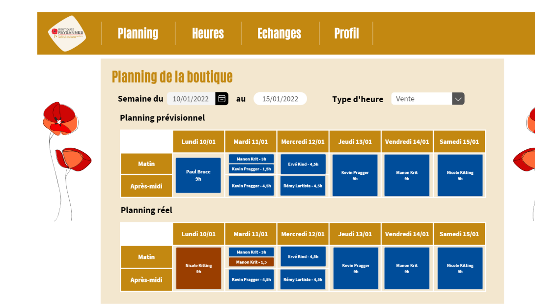
Fonctionnalité : "Voir le planning"

* Profit : Gain de temps * Planet : Contraintes environnementales * People : expérience utilisateur et notification d'application